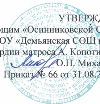
ГРАФИК родительского контроля организации питания обучающихся «Осинниковской ООШ» - филиал МАОУ «Демьянская СОШ имени гвардии матроса Андрея Копотилова» Уватского муниципального района на 2023-2024 учебный год